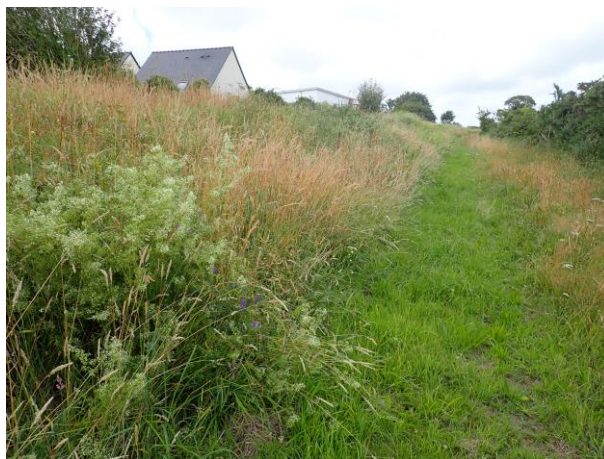
Figure 10 : Chemin sur la levée à l'ouest du terrain de football

Les abords du terrain de football (en particulier la levée en grande partie non fauchée à l'ouest) semblent plus pauvres en abeilles, malgré la présence de quelques fleurs non observées sur les autres stations (vesce, gaillets). Le vent ayant forcé lors de la prospection de cette station explique peut-être en partie cette moindre diversité apparente.