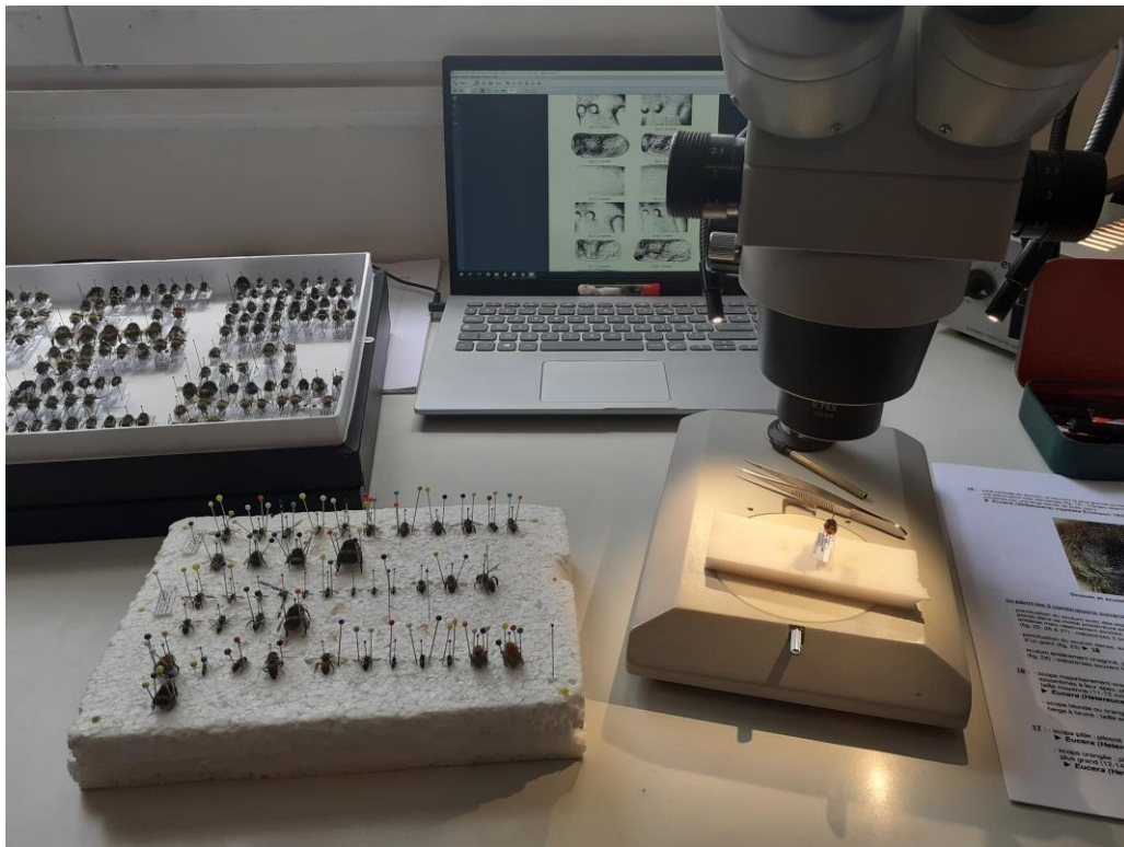
Figure 6 : Séance de préparation et d'identification d'une espèce de bourdon

Les sites ont été spécifiquement prospectés pour ces groupes taxonomiques lors de journées d'inventaire en chasse à vue et au filet à papillons, le 30 juillet 2021 pour le campus de Brest et le 8 juillet et le 19 août pour le campus de Nantes. La prospection sur le campus de Brest a été faite dans des conditions météorologiques correctes sans être optimales : beau temps, mais beaucoup de vent. Sur le campus de Nantes, la visite du 30 juillet a été réalisée dans des conditions peu favorables (passages pluvieux), c'est pourquoi une seconde prospection a été menée le 19 août dans des conditions optimales. Les abeilles, ne pouvant sauf dans de rares cas être identifiées sur le terrain, ont été pour la grande majorité d'entre elles prélevées et mises en collection pour identification au laboratoire sous loupe binoculaire à l'aide de clés de détermination et de collections de référence.