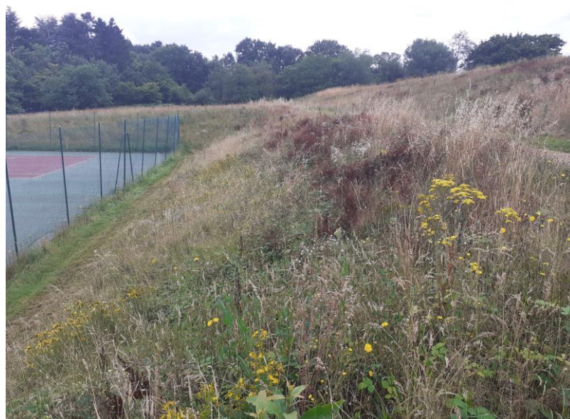
Figure 13 : Levée de terre située entre le terrain de tennis et le terrain de rugby