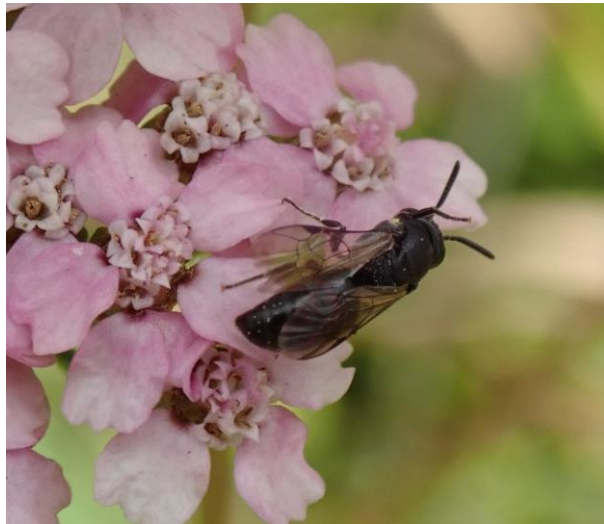
Figure 9 : Hylaeus communis sur achillée millefeuille dans la friche sud

Les abords du terrain de football (en particulier la levée en grande partie non fauchée à l'ouest) semblent plus pauvres en abeilles, malgré la présence de quelques fleurs non observées sur les autres stations (vesce, gaillets). Le vent ayant forcé lors de la prospection de cette station explique peut-être en partie cette moindre diversité apparente.