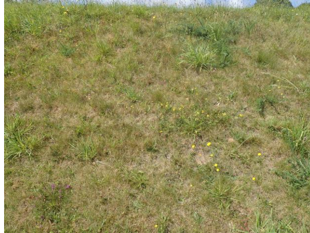
Figure 7 : Talus avec zones de terre nue permettant d'accéder à la prairie fleurie centrale

La zone centre-est était également abondamment fleurie, avec globalement la même flore que dans la zone précédente. C'est la station où le plus d'abeilles différentes ont été inventoriées. Elles étaient pourtant globalement moins abondantes que les tiphies ( Tiphia femorata ) et les syrphes (particulièrement des éristales) qui étaient les pollinisateurs dominants sur la zone (et globalement sur le campus). Des zones de terre nue potentiellement favorables à la nidification sont présentes sur les pentes à l'est de la prairie fleurie centrale, mais nous n'y avons pas constaté d'activité particulière.