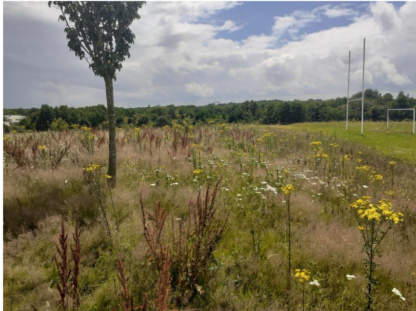
Figure 12 : Friche sèche dans la partie centrale de la zone prospectée (Baptiste HUBERT / GREZIA)