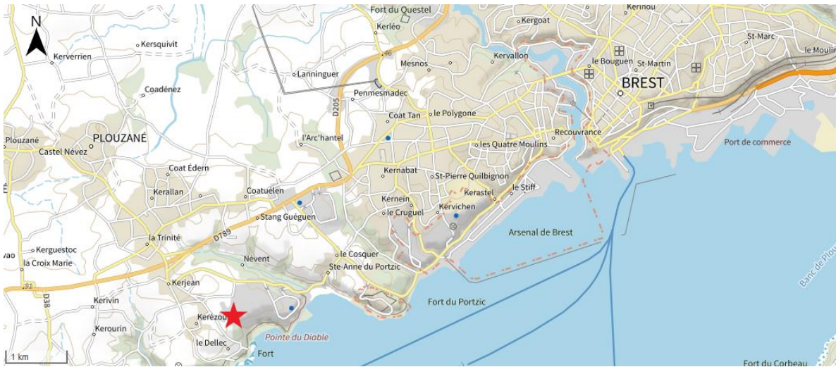
Figure 1 : Localisation du campus de Brest d'IMT Atlantique.