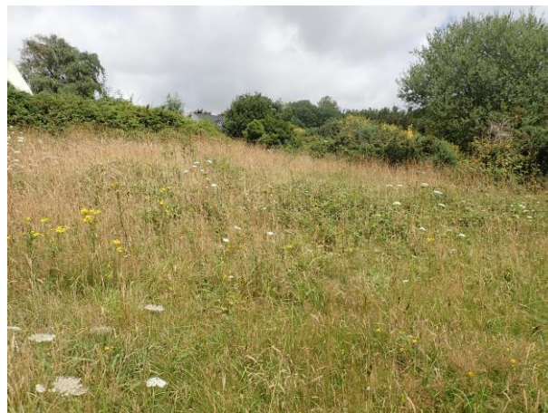
Figure 8 : Friche sud (Mael GARRIN / GREZIA)

La friche au sud semble abriter une apidofaune un peu moins diversifiée malgré la présence d'une flore différente avec également la présence de ravenelles, de cirses, d'achillée millefeuille. On note par contre la présence d'une belle population du genre Hylaeus (les quatre individus prélevés pour détermination appartenant tous à la même espèce : H. communis ) qui n'a été observé nulle part ailleurs sur le campus. Ces abeilles butinaient notamment l'achillée et doivent nidifier dans les broussailles de cette station. En effet, Hylaeus communis (et assez généralement les autres espèces du genre) niche préférentiellement dans les tiges creuses de divers végétaux.