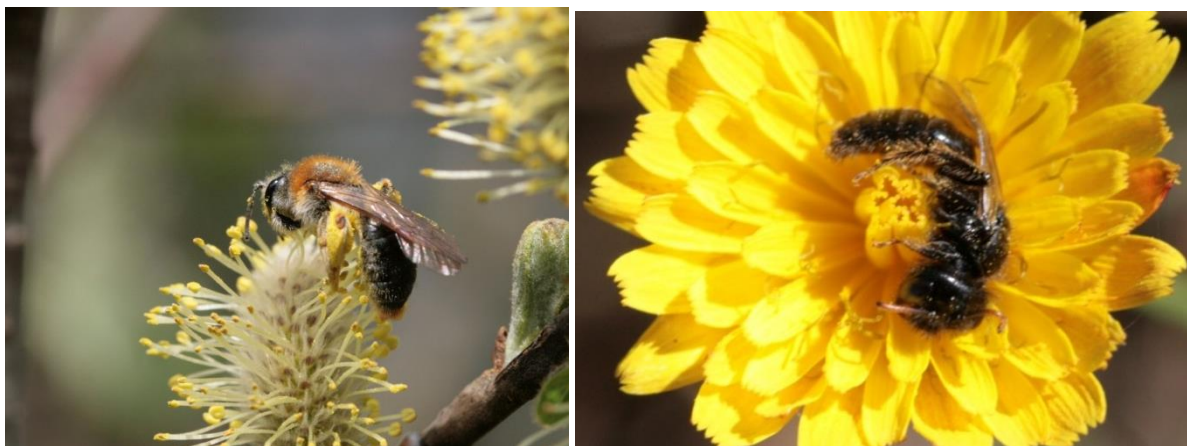
Figure 5 : Deux espèces d'abeilles sauvages : Andrena haemorrhoea et Panurgus calcaratus