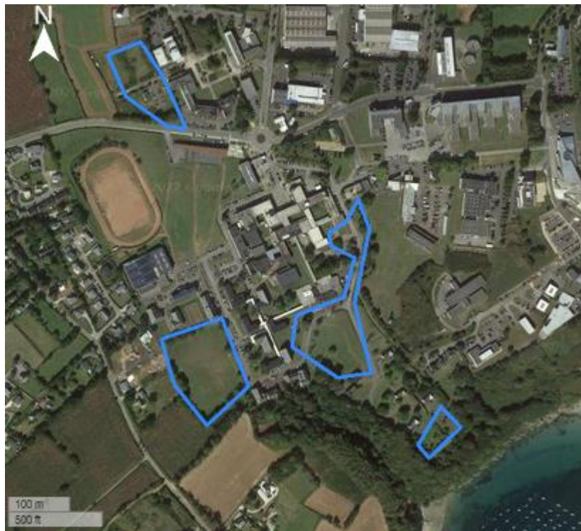
Figure 2 : Localisation des stations prospectées sur le campus de Brest d'IMT Atlantique (source : GoogleSatellite et Geonature GREZIA).