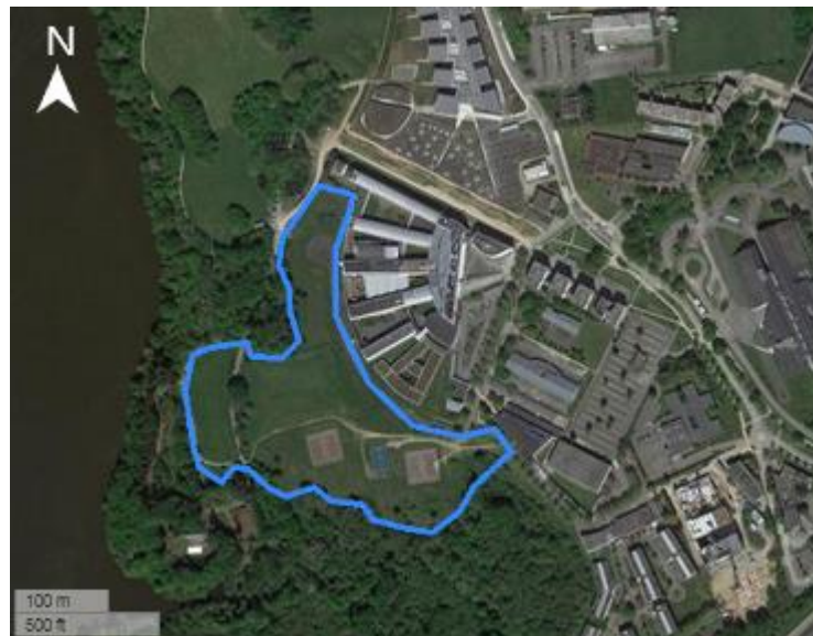
Figure 4 : Localisation de la station prospectée sur le campus de Nantes d'IMT Atlantique (source : GoogleSatellite et Geonature GREZIA).