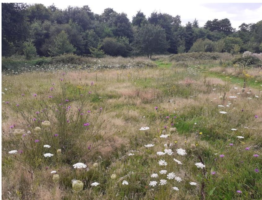
Figure 11 : Prairie mésophile richement fleurie au sud du campus